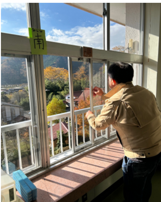
六日市小学校のサッシ修理