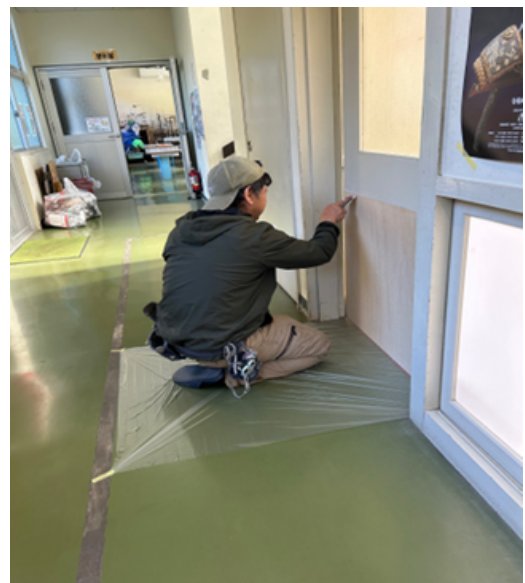
柿木小学校教室の戸の修理