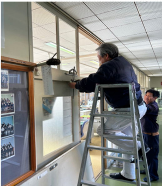
柿木小学校職員室の戸の修理

今年も各学校等からご要望をいただき、生徒や保育園児達が安心して施設を利用できるよう整備しました。