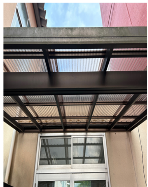
六日市小学校屋根の修理